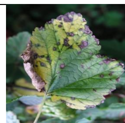
Antracnoza coacazului ( Pseudopeziza ribes )