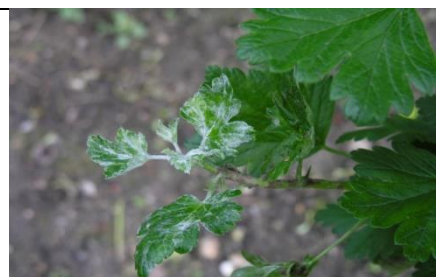
Fainarea europeana ( Microsphaera grossulariae ),

Daunatori la arbustii fructiferi. Gargarita neagra ( Anthonomus rubi )/ Afide/ Acarieni