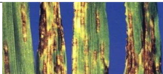
Sfasierea frunzelor ( Pyrenophora graminea )