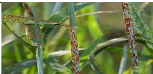
Rugina la cerealele păioase ( Puccinia recondita )