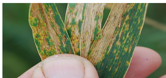
Patarea bruna ( Septoria tritici )