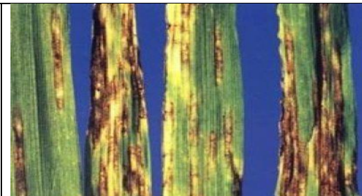
Sfasierea frunzelor ( Pyrenophora graminea )

Pentru combaterea agenților patogeni menționați recomandăm utilizarea produselor de protecție a plantelor omologate cum ar fi: