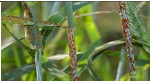
Rugina la cereale paioase ( Puccinia recondita )