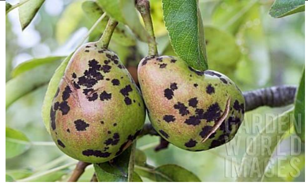
Venturia pirina ( rapanul parului)