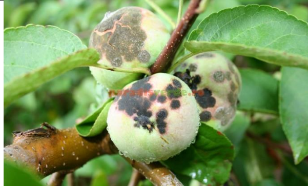
Venturia inaequalis ( rapanul marului)