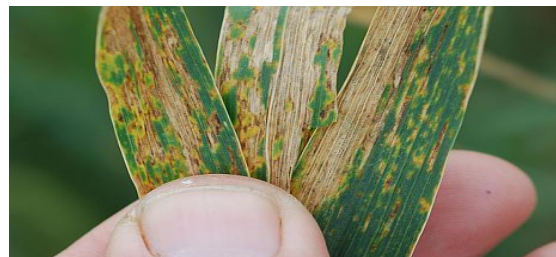
Patarea bruna ( Septoria tritici )