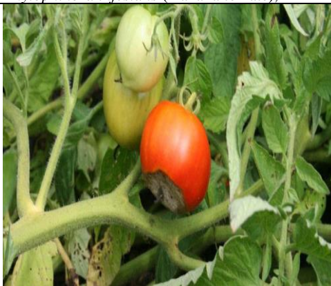
Colletotrichum coccodes (antracnoza)