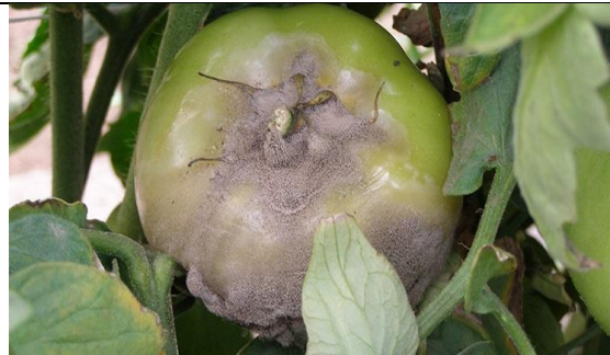
Bortyitis cinerea (putregaiul cenușiu la tomate)