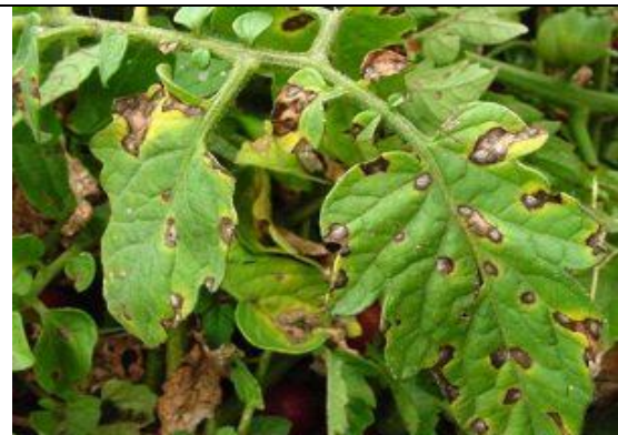
Fulvia fulva (patarea cafenie a frunzelor de tomate),