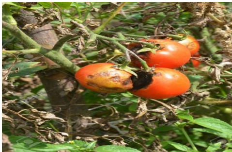
Phytophthora infestans (mana la tomate),

Condițiile climatice din ultima perioada au favorizat apariția și dezvoltarea următorilor agenți patogeni la cultura de tomate: Phytophthora infestans (mana la tomate), Bortyitis cinerea (putregaiul cenușiu la tomate), Colletotrichum coccodes (antracnoza), Fulvia fulva (patarea cafenie a frunzelor de tomate), Leveillula taurica (fainarea la tomate)