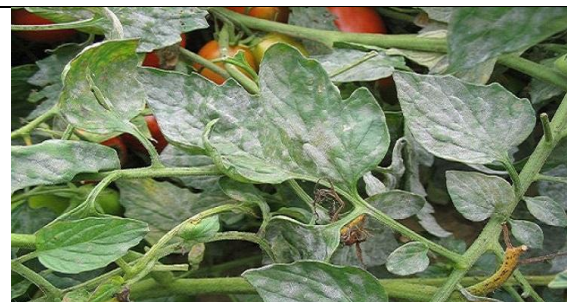
Leveillula taurica (fainarea la tomate)