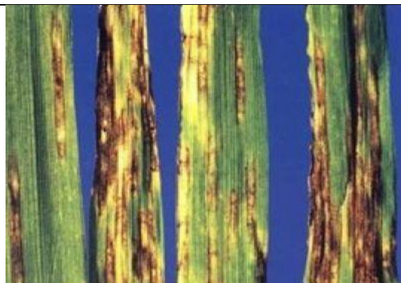
Sfâșierea frunzelor ( Pyrenophora graminea )