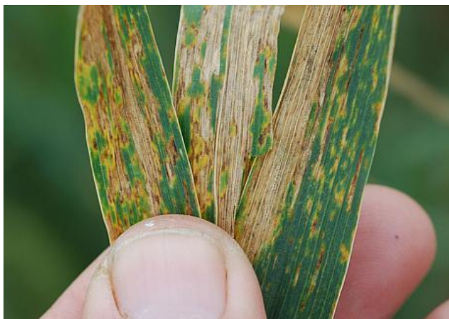
Patarea bruna ( Septoria tritici )