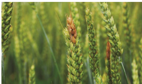
Fuzarioza la grau ( Fusarium spp. )